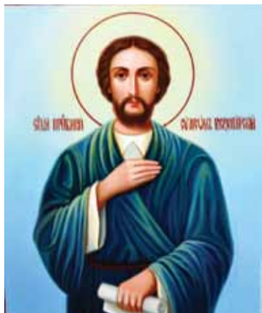
Праведный Симеон Верхотурский – один из небесных покровителей Урала и Сибирского края, великий праведник и назидатель человеческих душ.