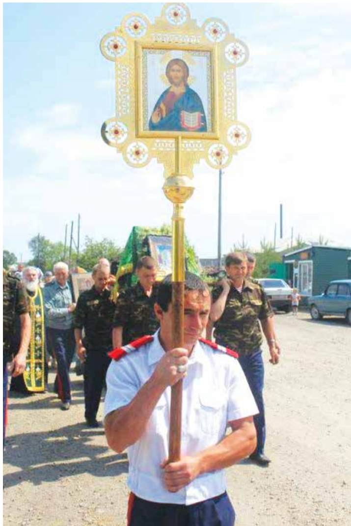
Окончание. Начало на стр.2

История Онуфриевского крестного хода началась более 150 лет назад, когда в с. Жарковском (нынешний посёлок Яя) разразилась страшная эпидемия, уносящая жизни детей. В то время в местном храме во имя преподобного Онуфрия Великого хранилась икона святого, имевшая славу целительной.